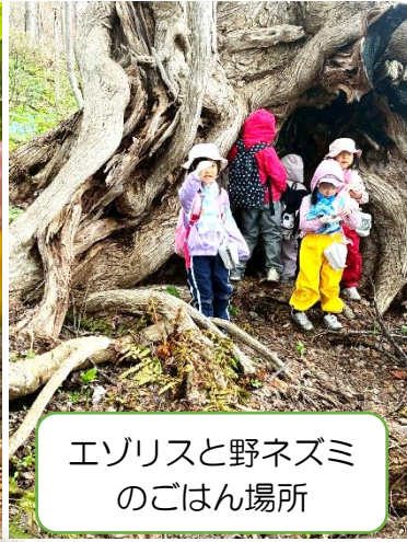
エゾリスと野ネズミのごはん場所