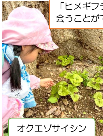
オクエゾサイシン