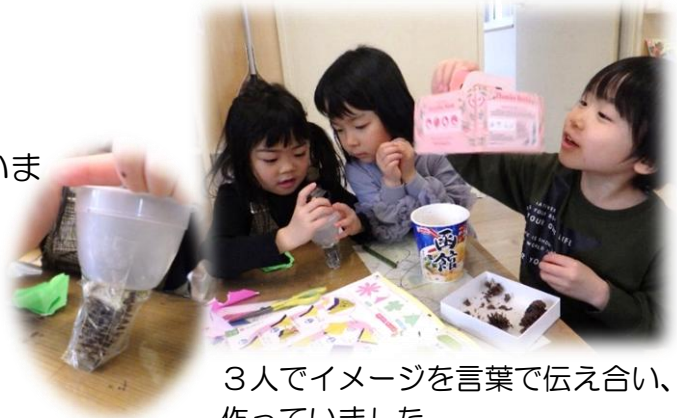
3人でイメージを言葉で伝え合い、作っていました。

金曜日に堤防で採ってきた自然物を使い、早速製作をしました。園にある廃材と組み合わせ、ケーキを作っていましたよ。自然物ならではの色と形を生かし、可愛らしいケーキが出来上がっていました。