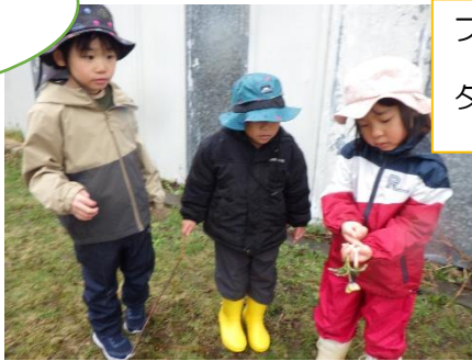
フクジュソウや タンポポの芽も見つけたね。