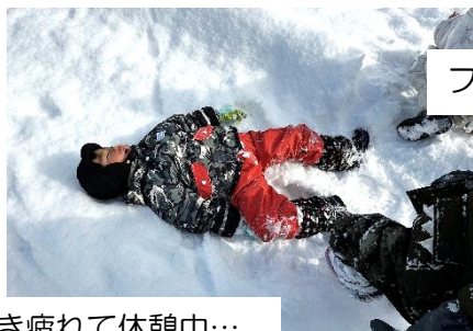
歩き疲れて休憩中…